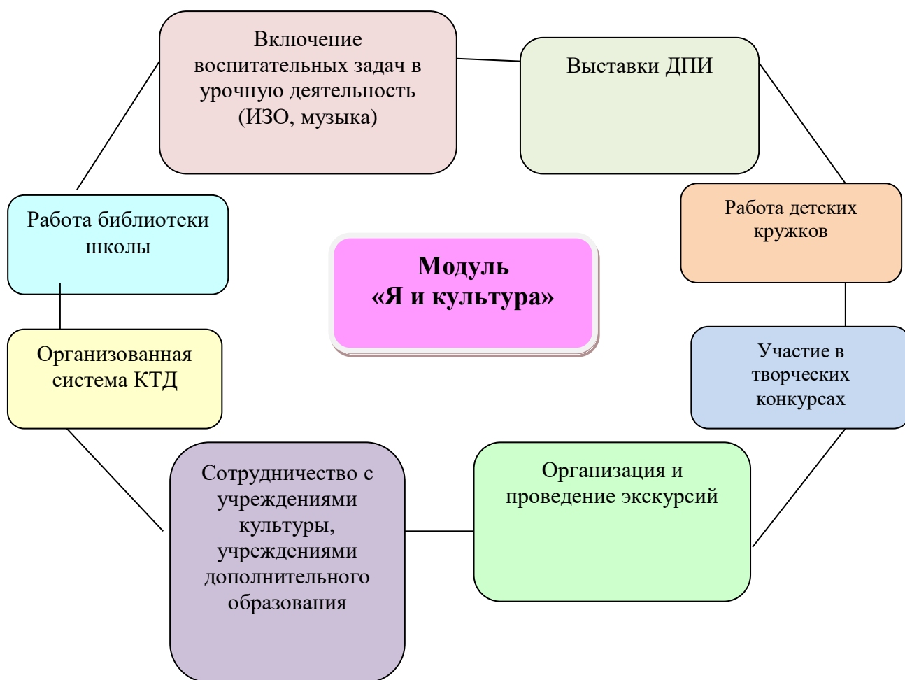
Схема 7. Пути реализации модуля «Я и культура»