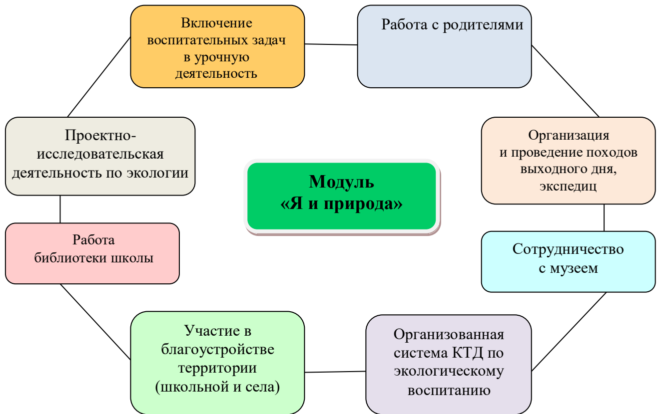
Схема 6. Пути реализации модуля «Я и природа»