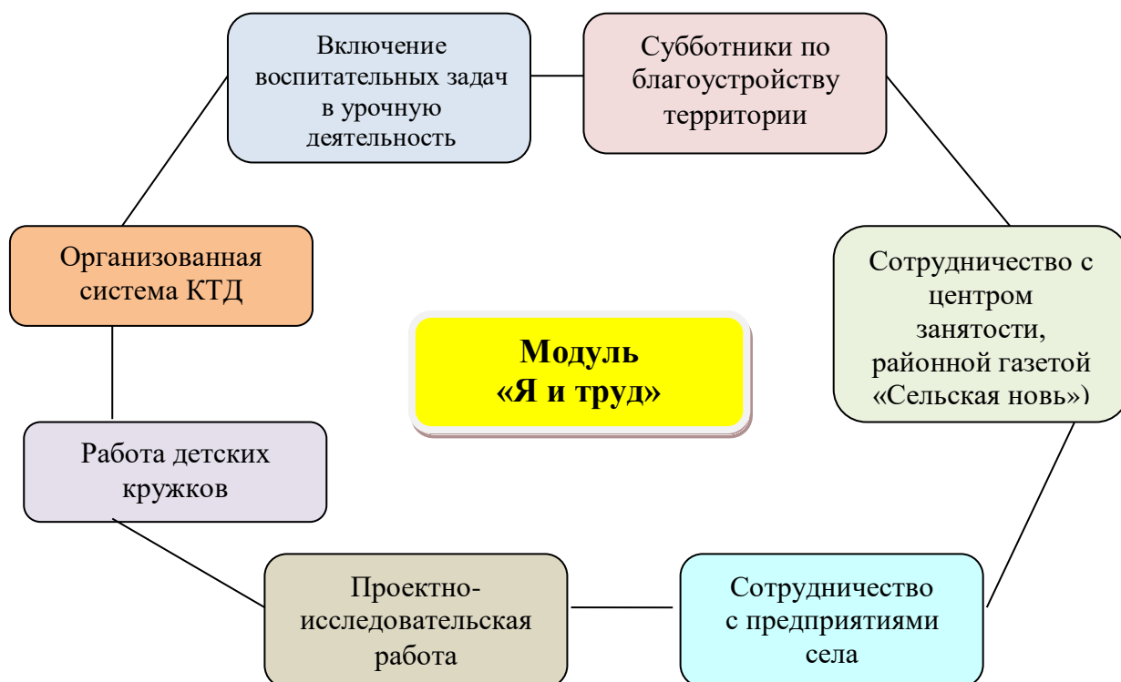
Схема 4. Пути реализации модуля «Я – и труд»