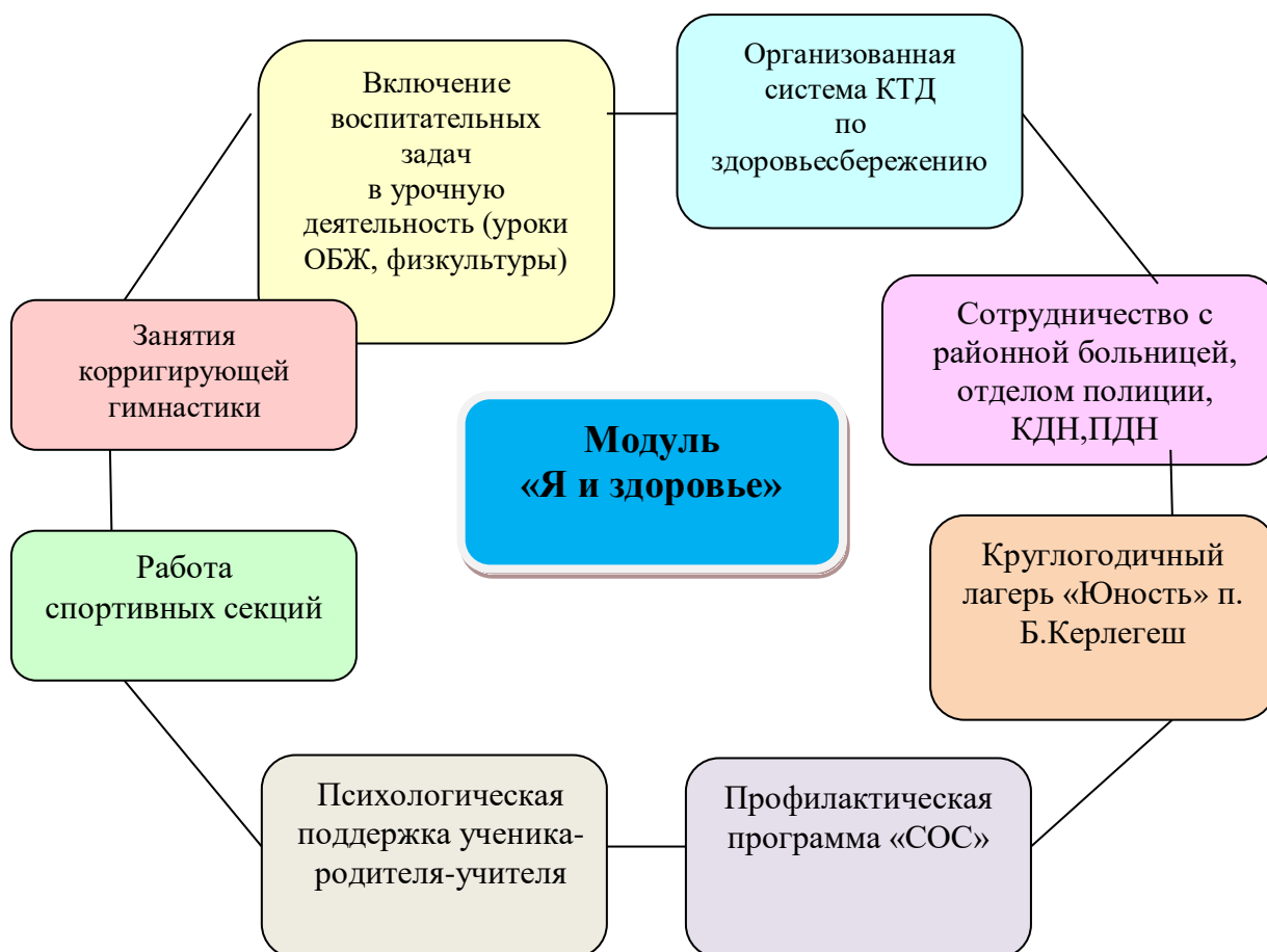
Схема 5. Пути реализации модуля «Я и здоровье»